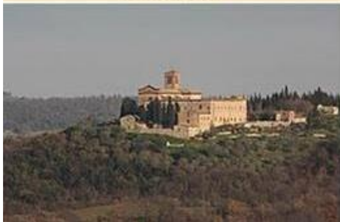
Monastero di Sant'Anna in Camprena