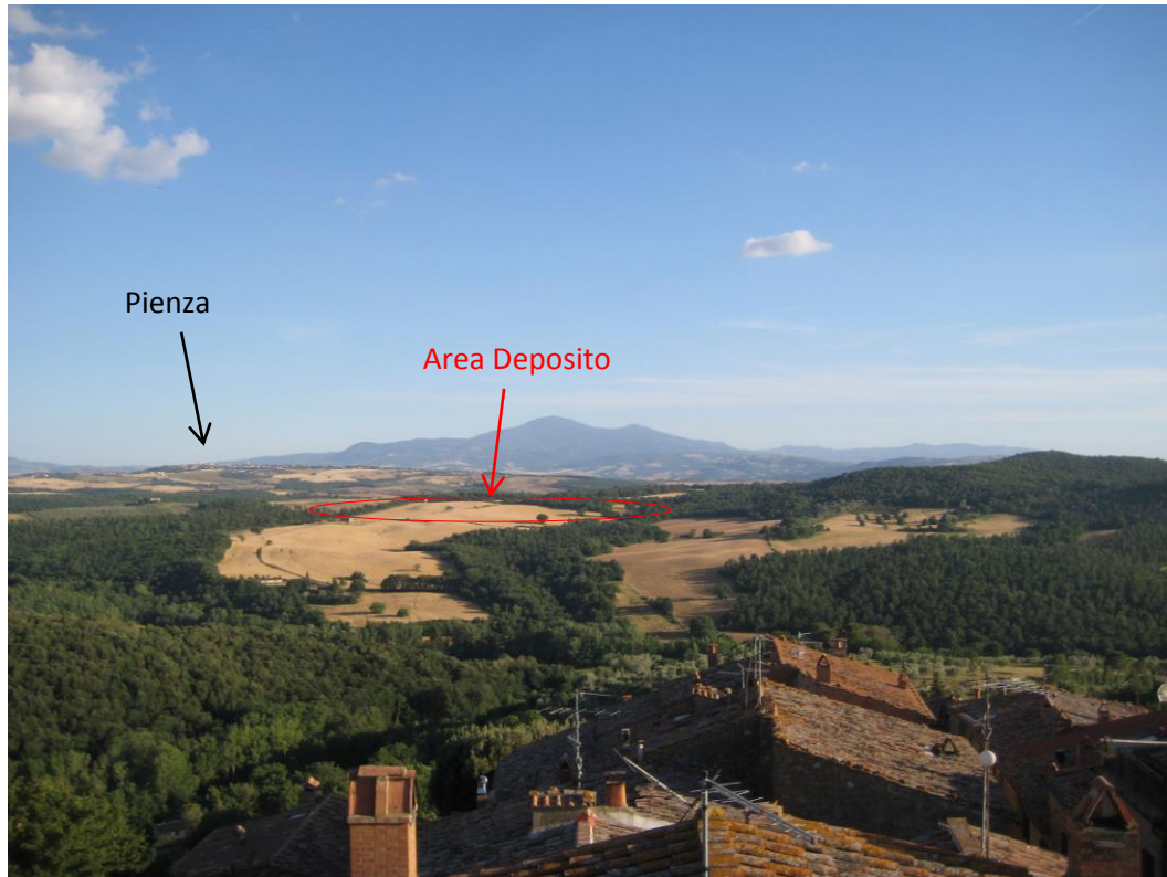
Veduta dalla Torre del Palazzo Fratini (Castelmuzio)