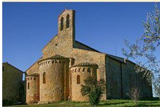
Pieve di Santo Stefano a Cennano