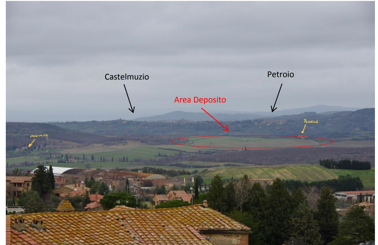
Veduta dal campanile Duomo di Pienza