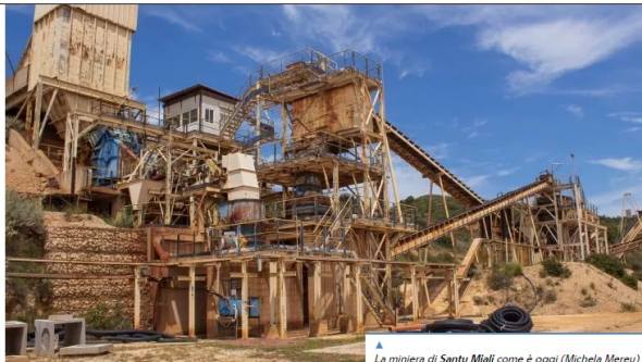
La miniera di Santu Miali come è oggi (Michela Mereu)