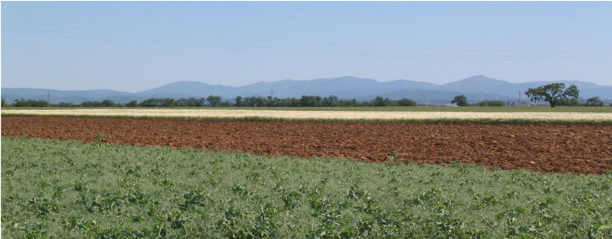
Foto paesaggio del sito individuato come AL1